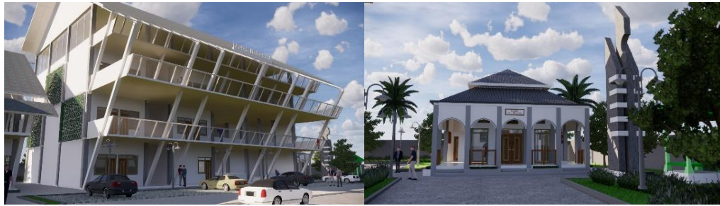
Gambar 9. Bentuk Bangunan (kiri) Gedung Penginapan; (kanan) Masjid