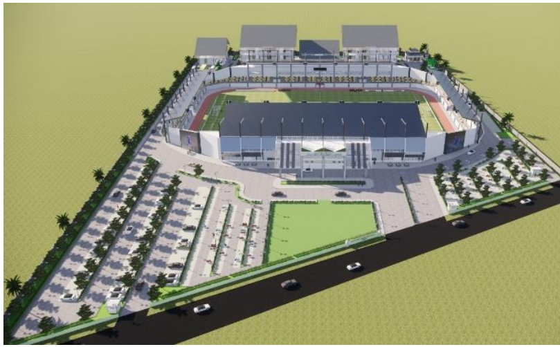
Gambar 6. Tataan lahan perspektif

Pada tataan lahan ini diambil dari bentuk pola yang ada di permukaan bola, sehingga bentuk lahan terlihat cukup lebar dan efektif untuk digunakan sebagai tempat fasilitas olahraga yang memiliki ruang terbuka cukup luas, dengan hal ini maka pola sirkulasi tataan lahan yang diterapkan juga sama seperti bola yaitu menggunakan pola radial. Penerapan arsitektur tropis modern yang diterapkan pada lahan ini yaitu ditandai dengan adanya vegetasi-vegetasi yang cukup banyak di dalam area site, penggunaan warna terang pada bangunan site dan tersedianya beberapa ruang terbuka hijau. Gambar berikut menunjukkan tampak prespektif dari tataan lahan kompleks pusat pendidikan dan pelatihan sepakbola di kabupaten Gresik.