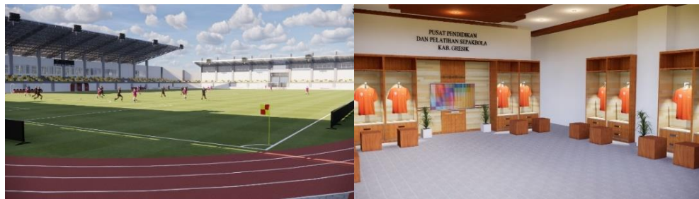
Gambar 10. Ruang (kiri) Lapangan Sepakbola; (kanan) Ruang Ganti Pemain

Pada area ruangan ini lebih ditekankan terhadap adanya kegunaan ruang yang sesuai dengan fungsinya, sehingga penentuan jenis ruang tersebut dapat ditinjau dari klasifikasi area seperti ruang pelatihan di lapangan, ruang pendidikan belajar, dan ruang pendukung lainnya. Penerapan ruangan ini juga lebih ditekankan terhadap adanya konsep adaptif dari tema tropis modern yaitu beradaptasi dengan kondisi iklim dan lingkungan sekitar, hal ini diterapkan dengan adanya desain bukaan jendela pencahayaan dan penghawaan alami yang cukup banyak, adanya beberapa vegetasi yang ada di dalam ruangan serta penggunaan material interior yang terkesan modern dan bernuansa lokal. Gambar berikut menunjukkan tampilan ruang yang ada didalam kompleks pusat pendidikan dan pelatihan sepakbola dikabupaten Gresik.