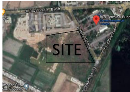
Gambar 4. Lokasi Site/tapak

lapangan dikarenakan cahaya matahari pada pagi hari akan memberikan manfaat lebih terhadap kesehatan tubuh.