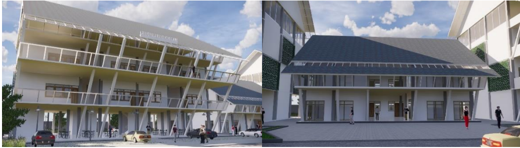
Gambar 8. Bentuk Bangunan (kiri) Gedung Pendidikan; (kanan) Gedung Kantor