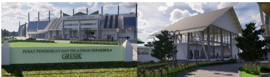
Gambar 7. Bentuk Bangunan (kiri) Stadion pelatihan; (kanan) Café dan restoran

Bentuk bangunan utama stadion pada rancangan ini diambil dari pola gambar pada bola dengan bentuk segi enam, sedangkan bentuk bangunan penunjang disesuaikan dengan bentuk sirkulasi tataan lahan. Pengembangan bentuk bangunan tersebut kemudian dilakukan dengan memunculkan bentuk 3D dari site dan pemotongan bentuk yang disesuaikan dengan kebutuhan ruang serta konsep modern dimana memiliki bentuk desain yang sederhana. Hasil pengembangan transformasi bentuk tersebut kemudian dipadukan dengan tema tropis modern yang diterapkan seperti adanya bentuk atap yang miring, terdapat area penghijauan, material menggunakan bahan yang modern, terdapat bukaan ruang dan jendela yang cukup lebar sebagai penghawaan dan pencahayaan alami didalam site. Gambar berikut menunjukkan bentuk-bentuk bangunan yang ada didalam kompleks pusat pendidikan dan pelatihan sepakbola di kabupaten Gresik.