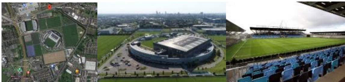
Gambar 3. Pelatihan sepakbola Manchester City (kiri) Site Plane; (tengah) Tampak Mata Burung; (kanan) Lapangan

Fasilitas yang ada pada bangunan ini adalah Lapangan sepakbola untuk latihan, lapangan sepakbola untuk bertanding, ruang belajar pendidikan, lapangan Indoor, Kantor, Area Kebugaran, kolam renang, spa, dan lain-lain.