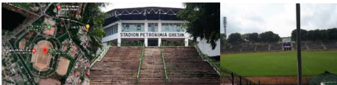
Gambar 2. Pelatihan Sepakbola Persegres (kiri) Site Plane; (tengah) Tampak Depan; (kanan) Lapangan

Kajian arsitektur yang terkandung dalam pelatihan sepakbola Persegres: (1) Tataan lahan menggunakan pola Radial. (2) Bentuk Bangunan perwujudan dari arsitektur Tropis dengan penggunaan atap miring dan terlihat oversteak, jendela yang cukup lebar. (3) Ruang memiliki material yang bernuansa alami. (4) Struktur material bangunan kebanyakan menggunakan beton, baja dan kayu.