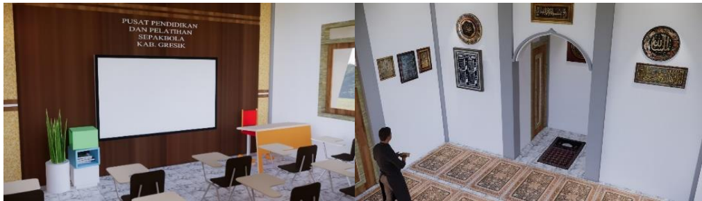
Gambar 12. Ruang (kiri) Kelas Teori; (kanan) Ruang Utama Masjid