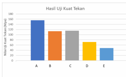
Gambar 5. Hasil Uji Kuat Tekan

Dari Gambar 5 di atas dapat diketahui bahwa nilai uji kuat tekan pada semua sampel lolos uji kuat tekan sesuai dengan SNI 03-0349-1989 dengan kategori :