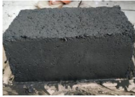
Gambar 1. Pencetakan Batako Hari Pertama

Pengujian kuat tekan pada penelitian ini dilakukan berdasarkan variasi campuran komposisi yang telah di tentukan, waktu pengerasan yang dibutuhkan dalam penelitian ini yaitu selama 28 hari dikarenakan semakin bertambahnya umur beton, maka akan meningkatkan nilai kuat tekannya. Pada umur awal nilai kuat tekan beton akan naik secara cepat ( linier ) dan mencapai maksimum pada umur 28 hari, dari setelah itu kenaikannya akan mengecil (Munir, 2008). Berikut ini merupakan gambar proses sebelum dilakukan uji kuat tekan pada Gambar 1, Gambar 2, Gambar 3, dan Gambar 4.