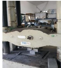
Gambar 4. Uji Kuat Tekan Batako

Pada Gambar 1 merupakan hasil pencetakan batako hari pertama setelah keluar dari cetakan, Saat proses pencampuran komposisi, akan terjadi reaksi kimia antara senyawa semen dengan air. Reaksi selanjutnya adalah interaksi antar senyawa tersebut, masing-masing saling mengikat, membentuk struktur baru yang kuat biasa disebut pasta, mortar, dan beton. Saat air ditambahkan dalam semen, setiap senyawa-senyawa tersebut mengalami reaksi hidrasi dan mempunyai andil masing-masing dalam proses pembentukan concentrate . proses hidrasi merupakan proses dimana komposisi kimia segmen saling berinteraksi dengan air (Mulyono, 2015). Gambar 2 yaitu perawatan ( Curing ) batako selama 28 hari yang bertujuan untuk menjaga kelembapan beton, karena jika beton cepan mengering maka dapat terjadi retak pada permukaannya. Kekuatan beton akan berkurang sebagai akibat dari keretakan yang dialami oleh beton dan juga dapat berakibat kegagalan mencapai reaksi hidrasi kimiawi penuh..