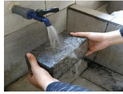
Gambar 2. Proses Perawatan Batako