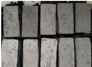
Gambar 3. Hasil Batako Setelah Proses Curing 28 Hari