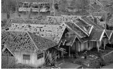
Gambar 1. Kerusakan bangunan akibat letusan gunung Kelud

oleh material yang dikeluarkan gunung Kelud pada saat terjadi letusan. Gambar 1 dan 2 adalah kerusakan bangunan akibat bencana gunung Kelud yang meletus Pebruari 2014 lalu.