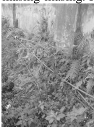
Gambar 9. Penempatan yang mengganggu pada bangunan

Beberapa tahapan telah dilaksanakan di dalam kegiatan ini. Dari hasil survei pendahuluan dan lanjutan diperoleh identifikasi data fisik, potensi, dan segala permasalahan di lapangan. Jika dilihat dari lokasi ketinggiannya, permukiman dusun Bales Pandansari berada pada posisi tinggi sehingga akan menimbulkan masalah dalam penyaluran air bersih. Gambar 6 dan 7 menunjukkan posisi dan lokasi permukiman masyarakat dusun Bales Pandansari Ngantang Kabupaten Malang. Gambar 7. juga memberikan informasi bahwa terlihat saluran berupa tiga pipa air bersih yang panjang, dimana pipa ini berasal dari tandon untuk tiga rumah yang berbeda namun bisa jadi berdekatan posisi rumah tersebut (bertetangga). Pipa yang digunakan juga bukan pipa untuk air, namun pipa penutup kabel listrik yang lebih tipis dan rapuh dibandingkan pipa air. Kondisi ini tentu menjadikan distribusi air tidak efektif, sebab satu saluran saja cukup dengan pipa lebih besar, jika mendekati lokasi dibagi atau didistribusikan menjadi tiga pipa yang menuju tiga rumah masing-masing. Kondisi yang sama ditunjukkan pada Gambar 8 dan 9.