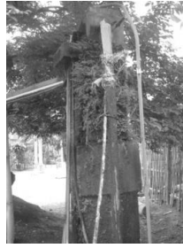
Gambar 16. Subtandon yang sudah mulai rusak