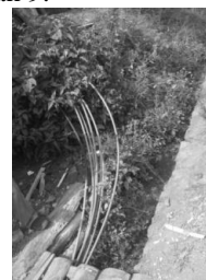
Gambar 11. Penempatan pipa yang tidak teratur

Distibusi air tidak terencana dengan baik, dimana pipa berbelok tanpa menggunakan model sambungan seperti pada Gambar 10 dan 11. Pipa yang disalurkan juga tidak terlindungi atau tertutupi dengan baik. Cukup dengan ditaruh di selokan atau ditimbun tanah sehingga akan membuat pipa mudah patah dan menimbulkan kebocoran air. Pengaturan ini tidak estetis dan mengganggu sirkulasi pambuangan di selokan. Kebocoran pipa akan mempengaruhi kualitas air yang disalurkan kepada masyarakat, sehingga kualitas air dari aspek higienis dan kesehatan tidak terjamin [2]. Sumber air utama berasal dari bukit sejauh jarak \pm 3 Km. Air dari sumber disalurkan dengan pipa utama (lihat Gambar 12) menuju tandon utama (lihat Gambar 13). Air dari tandon utama disalurkan menuju sub tandon yang dibagi 8 – 10 Kepala keluarga (KK). Tandon-tandon tersebut masih dibuat sederhana dengan pasangan bata (lihat Gambar 14-16). Setiap rumah memiliki pipa air tersendiri dari sub tandon tersebut, dengan tidak menggunakan satu pipa utama dibuat pipa percabangan menuju setiap rumah. Penerapan sub tandon semacam ini akan mengurangi tingkat higienis dan kesehatan air yang digunakan masyarakat untuk keperluan