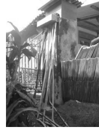
Gambar 14. Subtandon di sekitar rumah warga

Penerapan sub tandon demikian juga menyebabkan melubernya air ketika penuh oleh sebab ukurannya yang tidak mampu menampung kapasitas air. Sementara itu kran air di setiap rumah walaupun penuh tetap dibiarkan terbuang yang menyebabkan tidak efisien, padahal area ini sulit dalam penyediaan air bersih (lihat Gambar 17 dan 18). Luberan air dapat dimanfaatkan untuk menyiram tanaman, memelihara ternak, dan dialihkan untuk kepentingan pengairan (irigasi).