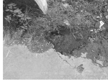
Gambar 17. Melubernya air karena kebocoran pipa dari tandon

Sistem penyaluran air bersih secara global ditunjukkan pada Gambar 19 dengan skema penyaluran pipa air bersih. Prasarana penyedia air bersih terdiri dari satu tandon utama yang bersumber dari sumber artesis dari bukit sebelah dusun dan 8 sub tandon yang dialirkan kepada 8-10 rumah tinggal. Hasil survei menunjukkan potensi yang ada di lokasi yakni telah tersedia material pasir dan bongkahan batu hasil erupsi gunung Kelud (lihat Gambar 20 dan 21). Material pasir dan batu tersebut dapat digunakan sebagai penyusun cor beton bertulang untuk konstruksi bangunan dan tandon air [3]. Potensi yang lain adalah tumpukan pipa sebagaimana pada Gambar 22 merupakan hasil sumbangan dari donatur dan potensi dusun Bales yang kaya akan material bambu petung (lihat Gambar 23). Potensi dalam hal material ini dapat digunakan untuk menata sistem penyaluran air bersih serta menambah kekuatan struktur dan konstruksi bangunan [4].