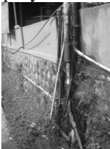
Gambar 18. Melubernya air tandon yang penuh

Sistem penyaluran air bersih secara global ditunjukkan pada Gambar 19 dengan skema penyaluran pipa air bersih. Prasarana penyedia air bersih terdiri dari satu tandon utama yang bersumber dari sumber artesis dari bukit sebelah dusun dan 8 sub tandon yang dialirkan kepada 8-10 rumah tinggal. Hasil survei menunjukkan potensi yang ada di lokasi yakni telah tersedia material pasir dan bongkahan batu hasil erupsi gunung Kelud (lihat Gambar 20 dan 21). Material pasir dan batu tersebut dapat digunakan sebagai penyusun cor beton bertulang untuk konstruksi bangunan dan tandon air [3]. Potensi yang lain adalah tumpukan pipa sebagaimana pada Gambar 22 merupakan hasil sumbangan dari donatur dan potensi dusun Bales yang kaya akan material bambu petung (lihat Gambar 23). Potensi dalam hal material ini dapat digunakan untuk menata sistem penyaluran air bersih serta menambah kekuatan struktur dan konstruksi bangunan [4].