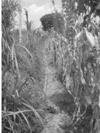
Gambar 12. Pipa dari sumber air utama

sehari-hari baik untuk mandi, masak, minum, cuci, menyiram tanaman, buang air, memelihara ternak, dan lain-lain.