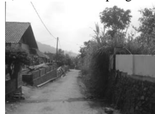
Gambar 5. Kondisi pemukiman masyarakat di Bales Pandansari Kabupaten Malang