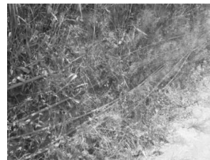
Gambar 8. Tidak efektifnya distribusi air bersih