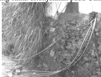
Gambar 10. Tidak teraturnya pendistribusian air melalui pipa