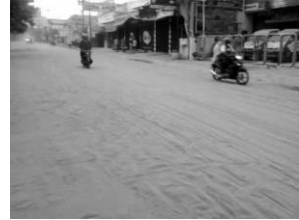
Gambar 3. Pasir hasil luapan gunung

Gambar 3 menunjukkan tumpukan pasir di area sekitar pemukiman warga sebagai akibat dan hasil semburan gunung Kelud yang meletus. Kegiatan pengabdian masyarakat Jurusan Teknik Arsitektur Fakultas Sains dan Teknologi UIN Maulana Malik Ibrahim Malang ini bertujuan untuk mengetahui dan melakukan identifikasi penataan sistem distribusi air bersih pasca bencana letusan Gunung Kelud. Kegiatan ini juga berupaya untuk mengetahui kondisi eksisting dan ketersediaan air bersih di dusun Bales desa Pandansari Kec. Ngantang Kabupaten Malang [1]