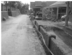
Gambar 7. Lokasi pada pemukiman dusun Bales