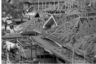
Gambar 2. Bangunan yang tertutupi oleh pasir dan debu