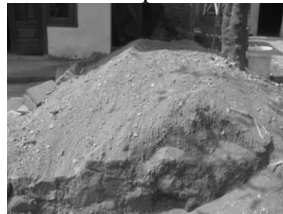
Gambar 20. Material pasir hasil muntahan gunung yang meletus