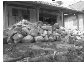
Gambar 21. Bebatuan material bawaan gunung Kelud