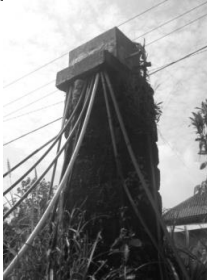
Gambar 15. Subtandon di lahan kosong

Penerapan sub tandon demikian juga menyebabkan melubernya air ketika penuh oleh sebab ukurannya yang tidak mampu menampung kapasitas air. Sementara itu kran air di setiap rumah walaupun penuh tetap dibiarkan terbuang yang menyebabkan tidak efisien, padahal area ini sulit dalam penyediaan air bersih (lihat Gambar 17 dan 18). Luberan air dapat dimanfaatkan untuk menyiram tanaman, memelihara ternak, dan dialihkan untuk kepentingan pengairan (irigasi).