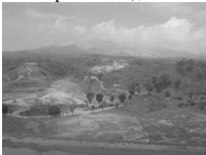
Gambar 4. Kondisi Setelah Gunung Kelud Meletus di Bales Pandansari Kabupaten Malang