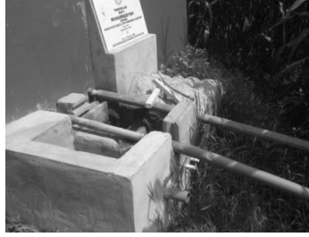
Gambar 13. Tandon utama penampung dari sumber air utama dari bukit