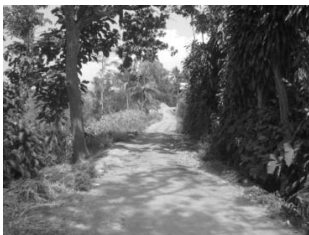
Gambar 6. Jalan akses masuk menuju dusun Bales