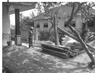
Gambar 23. Bambu dapat digunakan material penyokong konstruksi bangunan