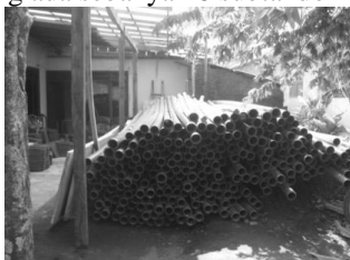
Gambar 22. Pipa air yang dapat digunakan untuk menata sistem distribusi air bersih

Kebutuhan air bersih di suatu rumah tangga berkisar 150 liter/orang/hari [5][6][7]. Hal ini berdasarkan standar data tingkat kebutuhan air bersih sebagai fasilitas utilitas bangunan [8][9][10][11]. Dari hasil survei data lapangan terlihat bahwa sistem distribusi air bersih di dusun Bales tidak terencana baik dan tidak efektif. Skema aliran sebagaimana pada Gambar 19 dapat dimodifikasi menjadi model sebagaimana pada Gambar 24, dimana dalam kondisi eksisting tandon yang ada sebanyak 8 subtandon didesain menjadi empat sub tandon.