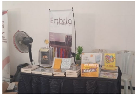
Gambar 1. Meja booth Embrio Publisher saat pameran di Sidoarjo