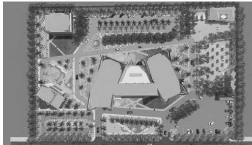
Gambar 2. Tatanan Lahan

Lokasi lahan berada di Jl. Jakarta, Karanggondang, Yosowilangun, Kec. Manyar, Kabupaten Gresik, Jawa Timur. Dengan peruntukan lahan perdagangan dan jasa sesuai dengan fungsi dari bangunan ini yaitu untuk melatih kemampuan yang akan membuka jasa desain dan menjual hasil karya dari para seniman. Tatanan lahan menerapkan konsep Responsif, menerapkan tatanan lahan yang tidak simetris supaya pengguna tidak mudah bosan dan menggunakan pola paving abstrak untuk menggambarkan kreativitas sesuai dengan karakter pengguna fasilitas. Penerapan vegetasi untuk merespon keadaan iklim sehingga area lahan menjadi nyaman dan teduh.