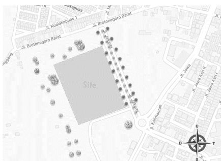
Gambar 1. Lokasi Tapak

Lokasi lahan berada di Jl. Jakarta, Karanggondang, Yosowilangun, Kec. Manyar, Kabupaten Gresik, Jawa Timur. Dengan luas tapak yang dipilih 2 Ha. Berada di area fungsi lahan perdagangan dan jasa. Sesuai data dari Kabupaten Gresik tahun 2010 – 2030. Lokasi sangat strategis, berada di kawasan yang berkembang serta dekat dengan fasilitas lainnya dan juga akses menuju lahan sangat mudah. Dengan peraturan sebagai berikut : KDB (Koefisien Dasar Bangunan) maksimum 60%, KDH (Koefisien Dasar Hijau) minimum 30%, KLB (Koefisien Lantai Bangunan) maksimum 2, Ketinggian bangunan maksimum 4 lantai, GSB (Garis