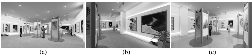
Gambar 4. a) Suasana Ruangan Galeri, b) Penyajian Hasil Karya, c) Bentuk Damar Kurung Sebagai Media Penyajian Karya

Adapun keterkaitan hubungan yang fungsional antara kegiatan yang dilakukan dan diterapkan secara berdekatan maupun sebaliknya sehingga pemilihan rancangan ruang menerapkan konsep Ekspresif yaitu Menciptakan desain ruangan yang mampu untuk memberikan suasana yang menarik, memikat, serta nyaman bagi para pengunjung sehingga mampu untuk memunculkan kesan dan dapat menggambarkan ekspresi diri serta membuat penggunanya merasa nyaman [9].