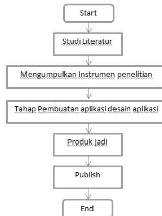
Gambar 3.1 Flowchart metodologi penelitian

Metodologi penelitian yang digunakan oleh penulis dalam proses penyusunan penelitian ini dapat diilustrasikan dengan gambar 3.1.