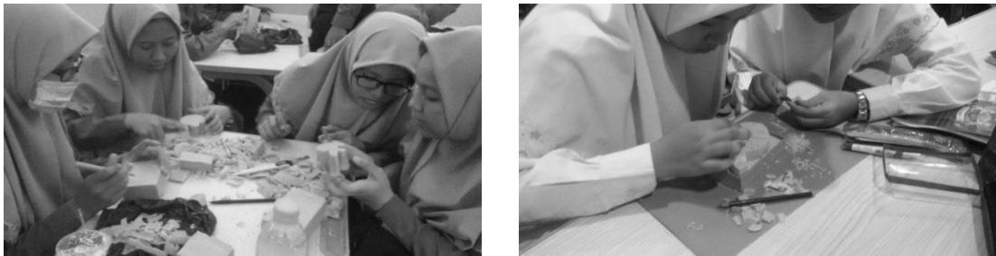
Gambar 4. 2 Kewirausahaan melalui prakarya dari sabun di SMA Muhammadiyah 1 Gresik

Kegiatan kedua dilakukan dengan sasaran praktek kewirausahaan, yaitu prakarya melalui media sabun untuk kelas XI MIA-1 hingga XI MIA-4 dan XI IBBu dan konsep masakan tradisional untuk kelas XII IPS 1 hingga XII IPS 3 yang kemudian dilanjutkan dengan mengeksekusi konsep tersebut sehingga memiliki nilai saji dan cita rasa yang berbeda. Berdasarkan hasil pengamatan di tiap kelas, para siswa terlihat antusias dalam membuat prakarya dari sabun (Gambar 4.2). Setelah membuat prakarya sabun selesai, kemudian dilanjutkan dengan mengemas hasil prakarya dengan baik dan menarik (Gambar 4.3). Melalui prakarya dari media sabun, siswa diharapkan memiliki kreatifitas dan inovasi dalam memanfaatkan media yang disekitarnya (sabun) sehingga memiliki nilai jual. Menurut [1] inovasi dan kreatifitas adalah inti dari kewirausahaan. Kedua hal tersebut perlu dimiliki dan dikembangkan dalam diri wirausaha demi perkembangan dan kesuksesan sebuah usaha. Pengembangan usaha membutuhkan kemampuan inovasi dan kreatifitas untuk menghadapi tantangan dalam usaha, khususnya untuk menemukan produk dan layanan yang unggul [1].