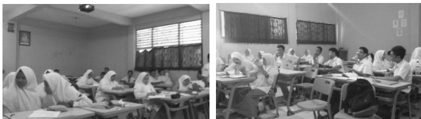
Gambar 4.1 Suasana kelas dalam penyampaian materi kewirausahaan di SMA Muhammadiyah 1 Gresik

Kegiatan pengabdian pada masyarakat dilaksanakan selama bulan Nopember 2015 di SMA Muhammadiyah 1 Gresik. Pengabdian masyarakat memiliki 2 kegiatan utama. Kegiatan pertama diawali dengan menyampaikan materi di kelas mengenai kewirausahaan.