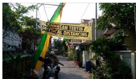
Gambar 2. Banner Physical Distancing Pada Perkampungan Klampis Ngasem

Kelurahan Klampis Ngasem termasuk dalam Kelurahan Klampis Ngasem, Kecamatan Sukolilo yang terletak di wilayah kota Surabaya bagian timur. Di wilayah ini terdapat perkampungan ini RT.2 RW.3 pada perkampungan Asem Payung terdapat banyak tempat fasilitas umum, di perkampungan ini terdapat banyak sekali beberapa institusi pendidikan mulai pendidikan tingkat dasar sampai dengan pendidikan tingkat tinggi (Universitas).