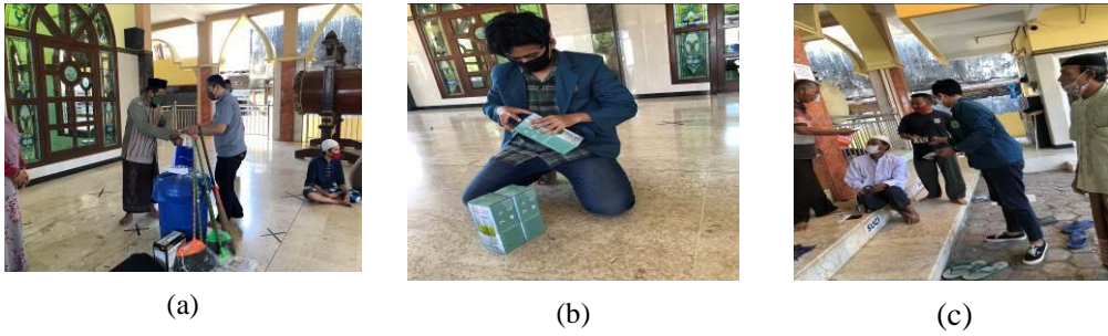
Gambar 5. a) Penyerahan Bantuan Alat Kebersihan, b) Pemasangan Hand Sanitizer, c) Pemberian Masker Untuk Jamaah Masjid