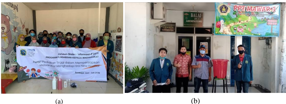
Gambar 6. a) Sosialisasi Kepada Guru PAUD, b) Penyerahan Wastafel Cuci tangan

Dari kegiatan tersebut kami juga mengadakan kegiatan sosialisasi kebersihan di dalam sekolah untuk merealisasikan protokol kesehatan di tempat kegiatan pendidikan yang dapat dilihat pada gambar 6.