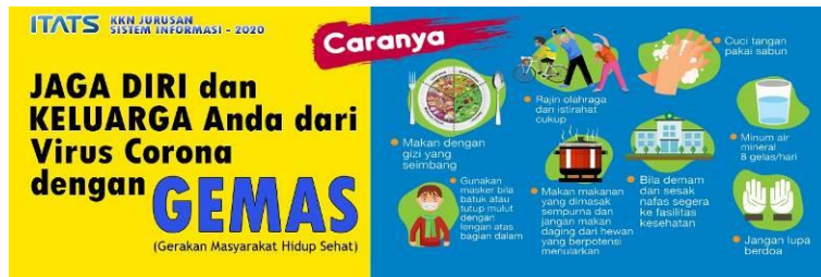
Gambar 4. Desain Banner Pencegahan Covid-19 Bagi Warga RT.2 RW.3 Klampis Ngasem