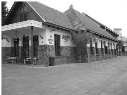
Gambar 2. Fasad The British Institute Surabaya

Memiliki bentuk arsitektur tropis yang menyatu dengan kondisi iklim di Indonesia.