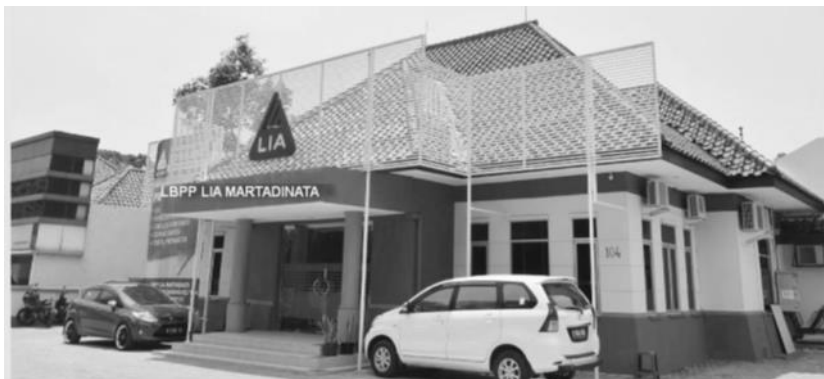
Gambar 3. Fasad LB LIA Martadinata Bandung

Memiliki estetika dari sunscreen yang dapat di terapkan pada rancangan bangunan