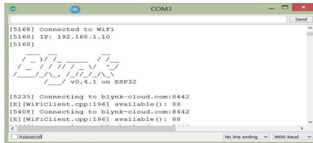
Gambar 4. Tampilan data Serial ketika BLYNK terhubung

awal terkoneksi dengan server BLYNK. Ketika sistem webserver BLYNK mengidentifikasi sistem dengan benar, maka IP harus diubah dengan memberikan IP-Publik. Pemrograman Arduino akan memberikan perintah untuk mengubah bentuk pola pemancaran dari AP menjadi client .