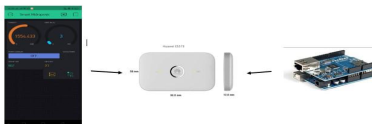
Gambar 2. Susunan Topologi Perangkat dengan ip masing – masing 192.168.43.1 untuk server BLYNK, 192.168.43.3 untuk modem, dan 192.168.43.2 perangkat Ethernet Shield

Pada penggunaan Ethernet Shield digunakan ISP yang di pancarkandari router Huawei 3In1. Router tersebut bertindak sebagai receiver data internet dan membagi IP melalui router internal yang terdapat dalam modem Huawei. Akses internet tersebut dibutuhkan untuk mendapatkan sinkronisasi data dengan server BLYNK. Bentuk koneksi ditunjukkan seperti pada Gambar 2, yaitu router-modem Huawei. Aliran data yang dipancarkan melalui Ethernet Huawei diteruskan pada Ethernet Shield . Kedua sistem akan saling merespon dan membentuk client-server. Pada modem Huawei ditambahkan setting DHCP untuk dapat memberikan IP pada sistem Ethernet. Ethernet tersebut menggunakan jalur SPI untuk berkomunikasi dengan Arduino[5]. Arduino memiliki SPI pada jalur data SCK, MISO dan MOSI. Reset digunakan sebagai penghapus data dari buffer komunikasi data SPI. Data yang terkirim akan mendapatkan IP dan diteruskan untuk terkoneksi dengan server BLYNK [6]. IP yang didapatkan dari perangkat modem adalah 192.168.43.3, serta 192.168.43.1 dari smartphone yang digunakan , dan 192.168.43.2 dari perangkat Ethernet Shield data tersebut diambil dari sistem serial yang mengidentifikasi data IP dari perangkat yang terkoneksi. Perangkat yang terkoneksi adalah satu buah modem-huawei dan smartphone sebagai wifi[7].