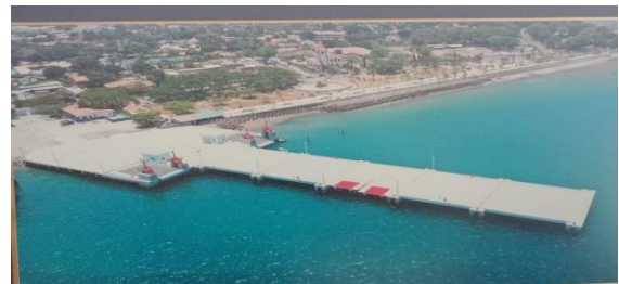
Gambar 1: Pelabuhan Dili Timor-Leste

atau minim dan kantor pelabuhan Administracao Dos Portos De Timor-Leste (APORTIL) berada di pelabuhan Dili Timor-Leste sedang pelindung I berada di pelabuhan Direção Nacional Transportes Maritimos (DNTM) berada dekat APORTIL. Pada dasarnya pelabuhan tersebut adalah satu yang menjadi perbedaan adalah DNTM milik Pemerintah sedangkan APORTIL adalah kantor swasta. Luas wilayah Kabupaten Dili Timor-Leste adalah 48,27 Km 2 , batas wilayah utara berbatasan dengan Australia, Timur berbatasan dengan NTT. Lokasi Pelabuhan Dili Timor-Leste terletak di Dili yang menghadap ke Laut Flores. Lebih jelas lagi lihat pada Gambar 1. di bawah ini.