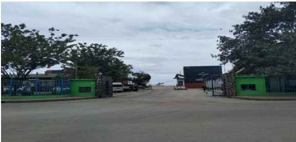
Gambar 4: Pintu Masuk pelabuhan Dili Timor-Leste

Untuk kondisi keamanan dan fasilitas di pintu gerbang utama (Gate) prosedur keluar masuk ke dalam pelabuhan Dili Timor-Leste pada saat ini yaitu masih menggunakan sistem keamanan secara manual untuk buka tutup. Untuk keamanannya masih terjaga ataupun terkontrol setiap saat. Untuk kondisi keamanan sedikit terjaga dan kontrol di pelabuhan tersebut berlakunya hanya saat kapal-kapal sandar dan itupun tidak seberapa ketat. Untuk lebih jelas melihat dan mengetahui kondisi keamanan dan fasilitas pintu gerbang utama pelabuhan Dili Timor-Leste seperti pada gambar 4.