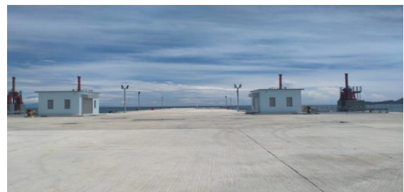
Gambar 2: Pelabuhan Dili Timor-Leste (Data Pribadi)

Kondisi keamanan Pelabuhan Dili Timor-Leste adalah tempat (lokasi) penelitian Skripsi dimana gambarnya dan kondisinya terlihat seperti gambar 2. di bawah ini, posisi gambar (lay out) dilihat dari tampak depan.