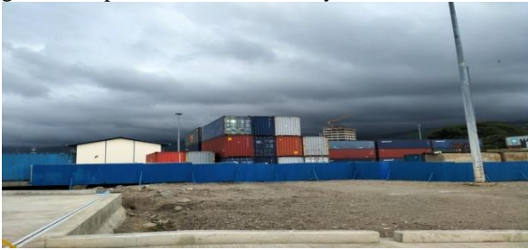
Gambar 3: Terminal Penumpang Dili Timor-Leste (Data Pribadi)

pelabuhan Dili Timor-Leste dapat melihat pada gambar 3. pada halaman berikutnya.