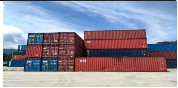
Gambar 5: Kondisi dan Fasilitas Lapangan Penumpukan peti kemas (Kontainer Yead) pada saat ini (Data Pribadi)

Kondisi Keamanan dan Fasilitas lapangan konteiner di pelabuhan Dili Timor-Leste pada saat ini hanya di pagar dengan tembok yang tinggi kurang lebih setengah meteran dengan jarak sekitar 1 meter, dengan kondisi seperti ini, sehingga masyarakat dengan mudahnya keluar masuk ke daerah atau area tersebut. Dalam hal ini artinya lapangan penumpukan Peti Kemas masih sangat terbuka dalam arti belum di batasi pagar Area atau Restricted Area. Kondisi keamanannya belum terpantau sama sekali. Untuk mengetahui lebih jelas lagi dapat dilihat pada gambar 5. di bawah ini.