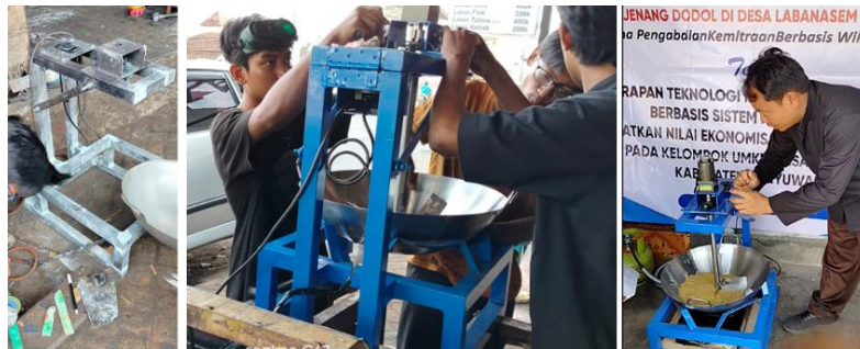
Gambar 4. Tahap perancangan mesin pengaduk jenang dodol berbasis sistem kontrol.

Adapun proses pembuatan dan perancangan mesin pengaduk diilustrasikan pada Gambar 4.