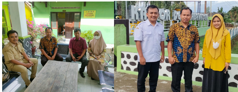
Gambar 3. Foto dari kegiatan koordinasi antara lembaga Poliwangi dengan Bapak Kaur Pemerintahan Desa Labanasem, Kecamatan Kabat.

para dosen pengusul dari Politeknik Negeri Banyuwangi dan surat permintaan kebutuhan teknologi sesuai RPJMD. Surat permohonan kerja sama dari desa maka kondisi ini yang menjadi dasar di dalam mengembangkan kegiatan industry yang ada di wilayah Desa Labanasem. Adapun foto dokumen kegiatan diskusi dan perbincangan dengan Kaur Pemerintahan diilustrasikan pada Gambar 3.