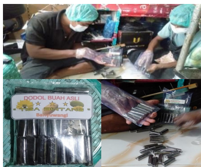
Gambar 8. Produk hasil olahan jenang dodol pasca-penggunaan mesin pengaduk otomatis.

Berdasarkan grafik pada Gambar 7, penghematan biaya tenaga kerja juga menjadi salah satu faktor penting. Pekerjaan pengadukan yang sebelumnya memerlukan dua orang, kini cukup dioperasikan oleh satu orang saja. Secara sosial, kegiatan ini menumbuhkan semangat kolaborasi dan inovasi di kalangan masyarakat desa. Pemerintah Desa Labanasem menyatakan dukungan terhadap keberlanjutan program ini melalui RPJMDes 2025, serta mendorong agar teknologi serupa diterapkan pada produk pangan lokal lain seperti jenang labu, dodol pisang, dan olahan singkong. Kegiatan mitra dalam proses pengemasan produk jenang dodol selalu memperhatikan dari program program pemerintah desa labanasem agar semua kegiatan mitra menjadi kegiatan unggulan ekonomi desa tersebut. Berikut dokumentasi pada kegiatan pengemasan produk jenang dodol yang bisa dilihat pada Gambar 8.