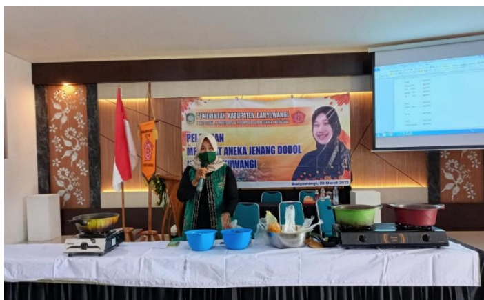
Gambar 1. Kegiatan pelatihan pembuatan jenang dodol khas Banyuwangi oleh GOW Banyuwangi.

Pemerintah Kabupaten Banyuwangi menunjukkan dukungan aktif terhadap pengembangan UMKM pengolahan jenang dodol. Usaha dodol merupakan salah satu Usaha Mikro Kecil Menengah (UMKM) yang sangat penting bagi ekonomi Indonesia karena UMKM merupakan penyumbang 60,34% Produk Domestik Bruto (PDB) Nasional [6]. Antusias para pengusaha jenang dodol dengan kegiatan pelatihan pembuatan jenang dodol khas Banyuwangi yang diselenggarakan oleh Gabungan Organisasi Wanita (GOW) Banyuwangi [1]. Adapun dokumentasi pada kegiatan tersebut diilustrasikan pada Gambar 1.