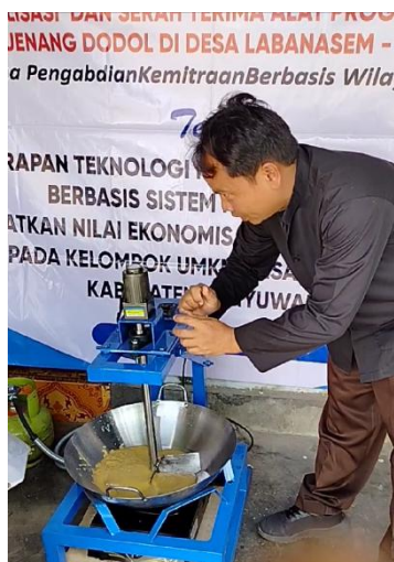
Spesifikasi Teknis Mesin Pengaduk Jenang Dodol Berbasis Sistem Kontrol