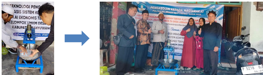
Gambar 5. Kegiatan pelatihan dan pendampingan pengoperasian alat di Desa Labanasem.

Evaluasi dilakukan dengan membandingkan produktivitas sebelum dan sesudah penggunaan mesin, meliputi: Waktu rata-rata proses pengadukan, Jumlah produk yang dihasilkan,, Penghematan biaya tenaga kerja, Peningkatan pendapatan penjualan. Hasil evaluasi awal menunjukkan adanya peningkatan efisiensi waktu produksi sebesar \pm 40\% dan kapasitas produksi meningkat hingga dua kali lipat dibandingkan metode manual.