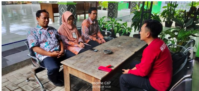
Gambar 1. Berkoordinasi dengan pihak pemerintah Desa Labanasem