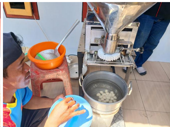
Gambar 4. Praktik pengoperasian alat.