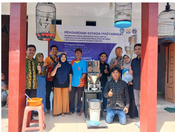
Gambar 5. Dokumentasi serah terima alat dari dosen ke mitra UMKM.