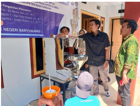
Gambar 3. Sosialisasi cara pengoperasian alat.

Gambar 6 merupakan gambar desain CAD alat cetak cilok yang diberikan kepada pihak mitra. Dari gambar tersebut dapat dilihat bahwa alat cetak cilok juga dilengkapi dengan pengaduk adonan serta tatakan panci. Alat cetak cilok ini sudah dilengkapi juga dengan 3 jenis ukuran cilok yang berbeda, yaitu ukuran 2 cm, 2,5 cm, dan 3 cm. hal tersebut bertujuan agar mitra dapat menggunakan cetakan manapun yang dikehendaki sesuai kebutuhan produksi yang diinginkan. Sedangkan Gambar 7 adalah rincian komponen yang ada pada alat cetak cilok.