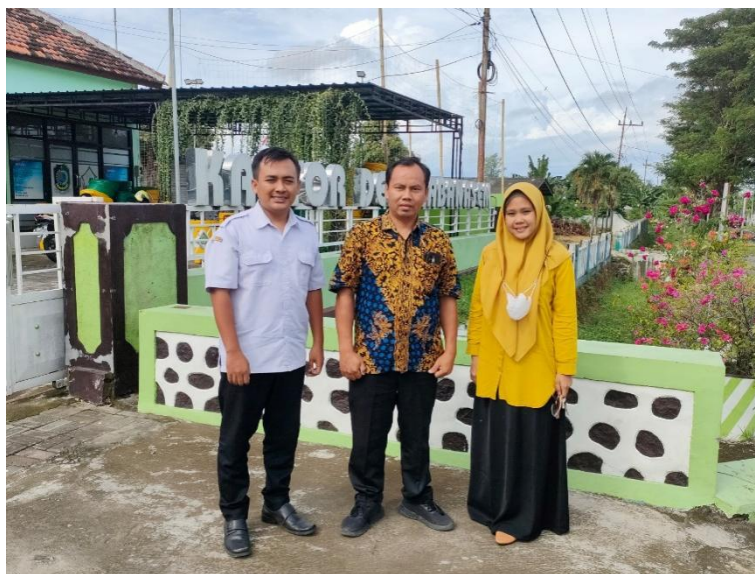
Gambar 2. Bersama pihak pemerintah Desa Labanasem akan menuju lokasi UMKM

Gambar 1 merupakan survei pertama pada tanggal 13 Januari 2025 dengan hasil yaitu koordinasi antara tim pengabdian bersama pemerintah Desa Labanasem untuk memetakan tingkat urgensi UMKM. Sedangkan Gambar 2 adalah dokumentasi antara tim pengabdian bersama pihak pemerintah desa yang akan bersama sama menuju lokasi UMKM untuk melakukan sesi diskusi prioritas masalah yang sedang dihadapi mitra.