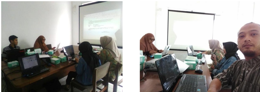
Gambar 2. Pelaksanaan Pelatihan Microsoft Word di Desa Cigugur Girang

Pelatihan Microsoft Word dilaksanakan di Desa Cigugur Girang dan dihadiri oleh 6 orang aparat desa. Sebelum dilaksanakan pelatihan Microsoft Word, diberikan terlebih dahulu daftar pertanyaan-pertanyaan yang sudah disusun pada tabel 2, tabel 3 dan tabel 4. Setelah dilaksanakan pelatihan Microsoft Word diberikan kembali daftar pertanyaan tersebut. Berikut adalah gambar dari pelaksanaan pelatihan tersebut.