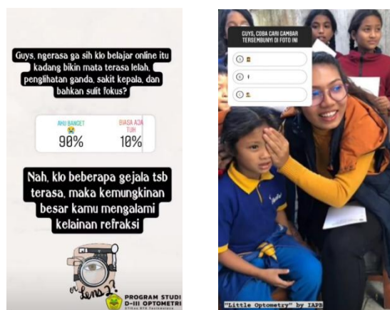
Gambar 2. Variasi penyampaian media menggunakan pertanyaan (kiri) dan permainan (kanan)

Dari setiap story yang ditayangkan Instagram “ Stories ”, dapat dilihat insight mengenai view dan discovery dengan story tersebut. Discovery adalah ukuran yang menunjukkan seberapa banyak orang melihat konten dan dimana mereka menemukannya. Besaran-besaran ini tidak dihitung secara manual tapi berdasarkan perhitungan algoritma yang telah ditentukan Instagram . Tabel 1 di bawah ini menunjukkan jumlah interaction dan discovery dari Instagram stories yang ditayangkan.