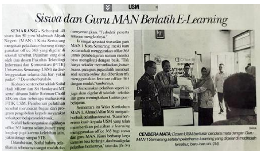
Gambar 4. Publikasi Kegiatan Pengabdian di Harian Suara Merdeka

Kegiatan pengabdian semester genap 2019/2020 selanjutnya masih diikuti oleh guru-guru MAN 1 Semarang untuk menjembatani permintaan pelatihan menggunakan Microsoft Teams dikarenakan saat itu pandemi Corona mulai melanda, pembelajaran di semua sekolah dialihkan menjadi pembelajaran jarak jauh atau online [3]. Microsoft Teams dipilih sebagai platform pembelajaran yang dapat digunakan untuk menunjang proses belajar mengajar. Pada kegiatan kali ini, jumlah peserta (guru) yang mengikuti kegiatan terpaksa di batasi dan waktu kegiatan pengabdian pun hanya dilakukan satu hari efektif, karena terkait dengan penerapan protokol kesehatan di masa pandemi. Hanya sepuluh orang guru sebagai perwakilan yang mengikuti kegiatan pengabdian seperti tampak pada Gambar 5.