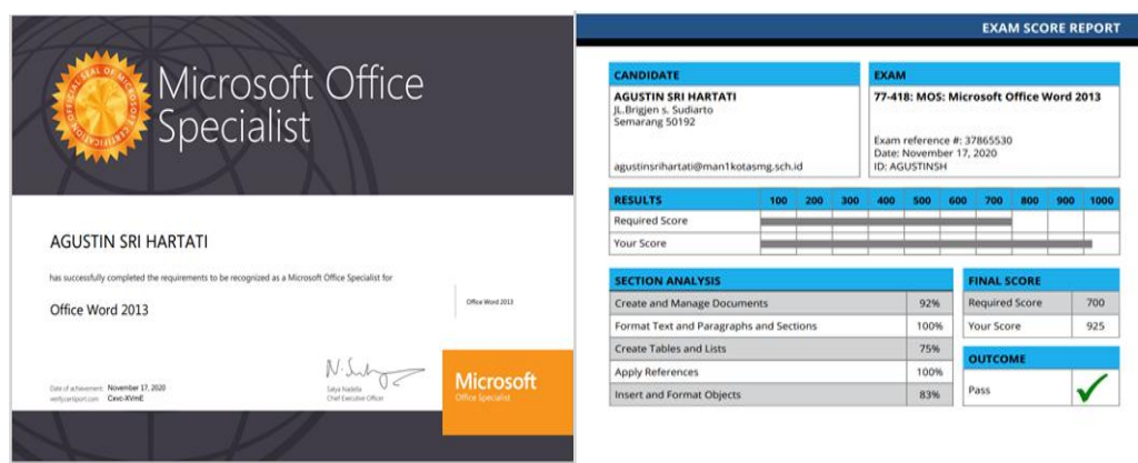
Gambar 8. Contoh Sertifikat Salah Satu Peserta

resmi yang dikeluarkan Microsoft karena hampir berjalan lima tahun ini, USM secara resmi telah berlangganan produk-produk Microsoft.