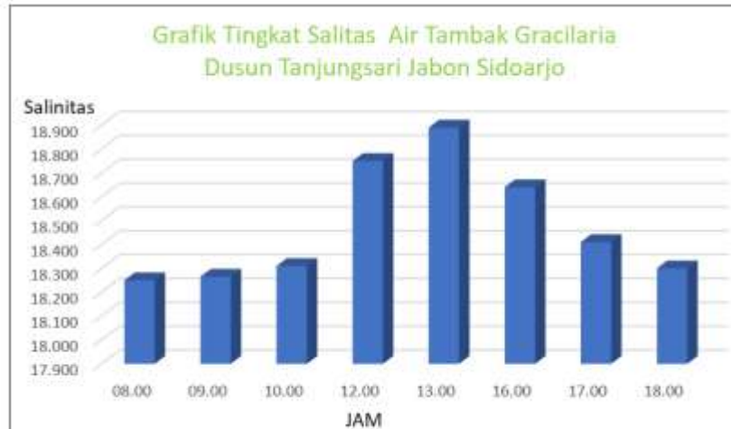
Gambar 7 : Grafik Tingkat Salinitas Air Tambak Gracilaria sp

Berdasarkan Tabel 1 Data Salinitas hasil pemantauan ditemukan bahwa nilai TDS mengalami fluktuasi harian yang signifikan dengan rentang antara 18.265 mg/L hingga 18.890 mg/L. Lonjakan tertinggi terjadi pada pukul 13.00 WIB, hal ini disebabkan oleh akumulasi panas yang memicu laju evaporasi secara maksimal. Fenomena ini menunjukkan bahwa deteksi salinitas tidak cukup dilakukan sekali, melainkan harus secara kontinue.