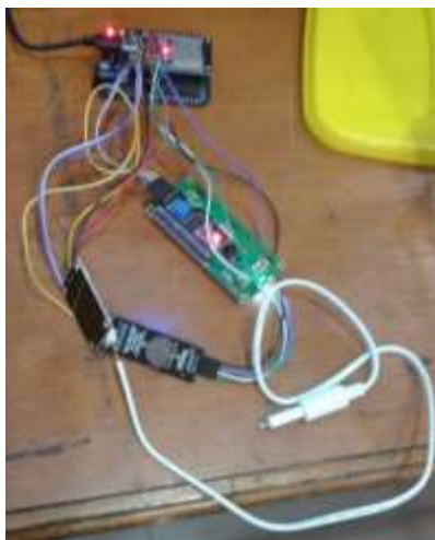
Gambar 6 : Prototipe Pendeteksi Cerdas Tingkat Salinitas Gracilaria sp