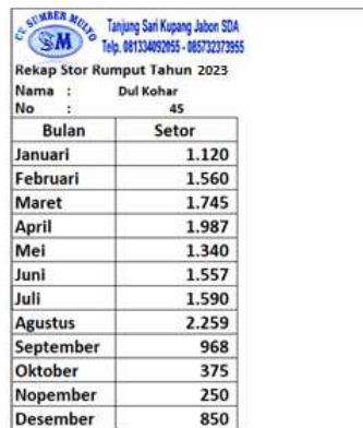
Gambar 1 : Rekap Setor Panen Gracilaria sp (Sukarmin n.d.)

Hasil panen tertinggi pada bulan Agustus sebesar 2.590 Kg dan terendah Oktober 375 Kg dan Nopember hanya 250 Kg. Pada puncak musim kemarau berdampak pada salinitas air tambak tinggi (letih Jawa). Sebagai masyarakat tradisional yang cukup lama membudidayakan gracilaria sp untuk mendeteksi salinitas cukup merasakan air (mencicip) dengan memasukan tangan kedalam tambak kemudian dirasakan kedalam mulut.