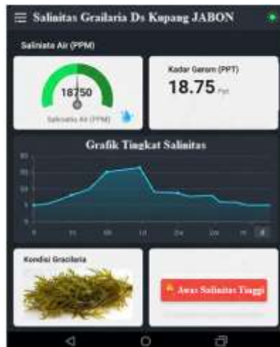
Gambar 5 : Dashboard Smartphone Salinitas Cerdas