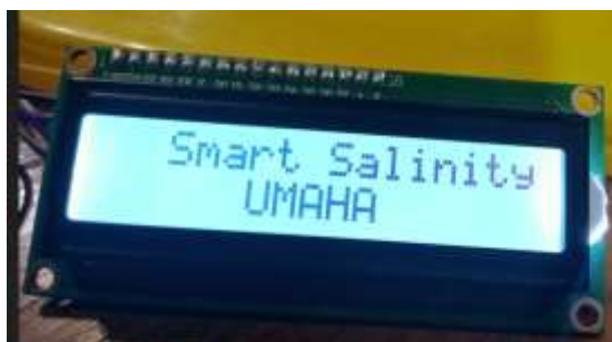
Gambar 4 : LCD Display Pemantau Lapangan

Hasil dari rancangan perangkat pendeteksi salinitas berupa rangkaian komponen elektronik dilengkapi lampu indikator dan LCD dot matrik screen sebagai informasi visual pada alat. Integrasi antara perangkat mikrokontroler dengan Internet of Things mampu menyajikan data hasil pemantauan sirkulasi air tambak secara langsung dan real-time . Sinergi teknologi ini memastikan bahwa setiap perubahan kondisi perairan dapat terdeteksi secara akurat (Intan, Pangerang, and Mulyawan 2020).