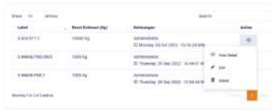
Gambar 7. Button view detail Incoming bahan baku