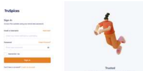
Gambar 3. Halaman Login akun