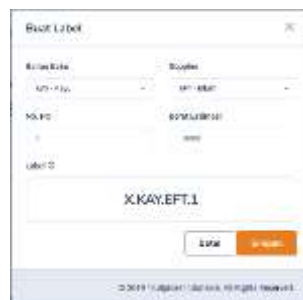
Gambar 6. Form label bahan baku

User mengisi form Label bahan baku terlebih dahulu, dengan menginput nama bahan baku, nama supplier , dan berat estimasi. Setelah melakukan pengisian form user mengklik button simpan untuk menyimpan data tersebut. Berikut tampilan form incoming bahan baku dapat dilihat pada gambar 6.