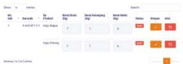
Gambar 13. Halaman Pengisian berat hasil sortir