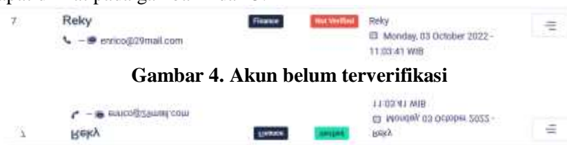
Gambar 4. Akun belum terverifikasi

Pada proses ini super admin yang memiliki super akses bertugas untuk melakukan checking apakah user yang melakukan registrasi benar karyawan dari pihak PT. TrueSpicesIndonesia, Jika benar super admin bisa memverifikasi akun yang melakukan registrasi itu. Penjelasan proses ini dapat dilihat pada gambar 4 dan 5.