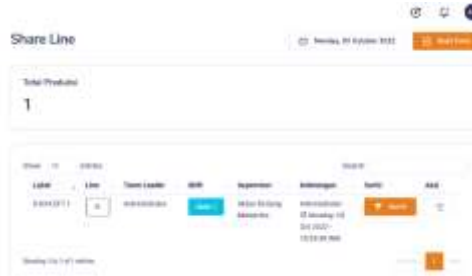
Gambar 11. Button Sortir di halaman utama shareline

Setelah user membuat form shareline , user harus mengklik button sortir yang muncul di halaman utama shareline sesuai dengan form yang telah di buat user . berikut tampilan button sortir dapat di lihat pada gambar 11.