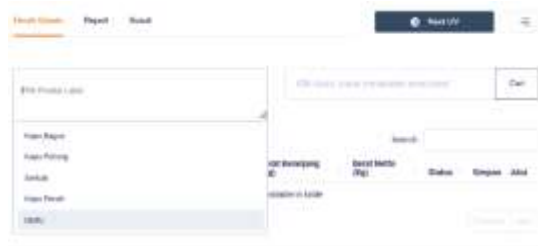
Gambar 12. Kolom pemilihan By Product dan Kolom Scan

Setelah mengklik button tersebut user akan masuk langsung ke halaman sortir. Pada halaman ini user dapat menginputkan hasil produksi dari bahan baku tersebut. Untuk menginputkan hasil produksi user harus mengscan label bahan baku dan memilih hasil produksi apa saja sesuai dengan yang ada pada master data bahan baku . berikut adalah tampilan tampilan proses sortir dapat dilihat pada gambar 12 dan 13.