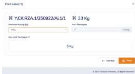
Gambar 16. Halaman pembagian finish produk sesuai ketentuan karung

Setelah menginput produk tersebut sudah lolos dari UV. User dapat mencetak label barcode finish product (Y) dengan rumus ketentuan kemasan/karung, berikut tampilan print label finish product dapat dilihat pada gambar 16 dan 17.