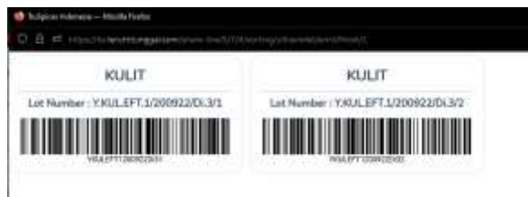
Gambar 17 : Label Barcode Finish Produk (Y)