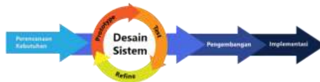
Gambar 1. Tahapan Metode RAD

Metode RAD merupakan pengembangan suatu sistem informasi dengan waktu yang relatif singkat (Sukanto & Shalahuddin, 2018). Untuk pengembangan suatu sistem informasi yang normal membutuhkan waktu minimal 180 hari. Namun dengan metode RAD suatu sistem dapat diselesaikan hanya dalam waktu 60-90 hari. Metode RAD ini berfokus pada proses pembuatan aplikasi berdasarkan pembuatan prototype, iterasi, dan feedback yang berulang-ulang dari user/klien. Dengan begitu, aplikasi yang dibuat bisa dikembangkan dan diperbaiki dengan cepat.