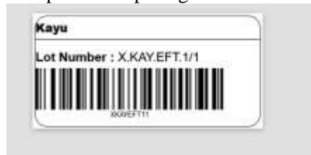
Gambar 9. Label Barcode Bahan Baku

Setelah melakukan penginputan berat bahan baku, user dapat melakukan print label barcode dan juga print report excel incoming. Untuk melakukan print label barcode user harus mengklik button print yang ada pada tampilan pengisian berat bahan baku. Berikut tampilan print label barcode incoming bahan baku dapat dilihat pada gambar 9.