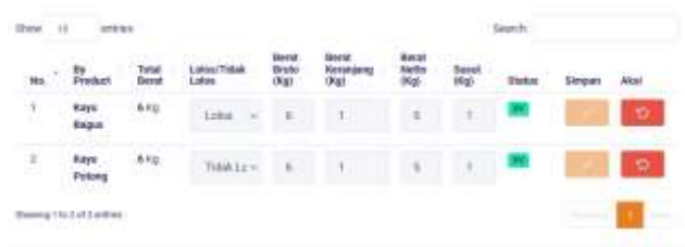
Gambar 15. Halaman pengisian berat dan pemilihan status UV

Setelah masuk di halaman UV. User dapat menginput status produk tersebut lolos atau tidak lolos dan juga menginput berat setelah proses UV, Setelah menginputkan berat tersebut akan muncul perhitungan deviasi berat dari proses sebelumnya. Berikut tampilan halaman UV dapat dilihat pada gambar 15.