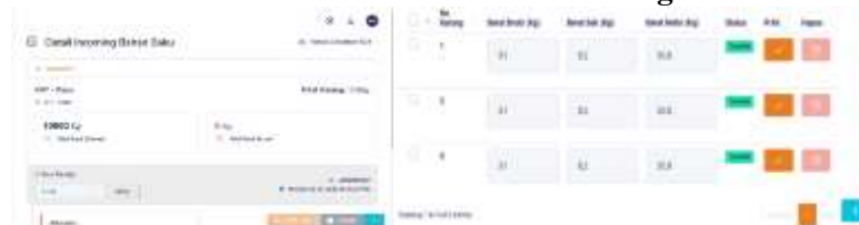
Gambar 8. Halaman Detail Incoming bahan baku