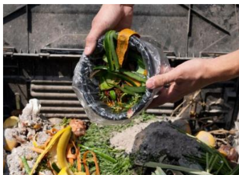
Gambar 5. Kegiatan santri dalam menyiangi sampah.

Gambar 5 menunjukkan kegiatan santri dalam menyiangi atau memilah sampah organik dari limbah dapur. Pada tahap ini, sampah dipisahkan antara bahan organik dan anorganik untuk memastikan hanya bahan yang sesuai digunakan dalam proses budidaya maggot . Kegiatan ini penting untuk menjaga kualitas media budidaya serta meningkatkan efektivitas proses penguraian. Selain itu, aktivitas ini juga melatih kesadaran santri dalam pengelolaan sampah yang baik dan berkelanjutan.