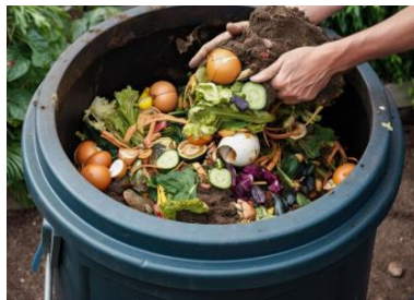
Gambar 4. Limbah dapur yang siap difermentasi.

Gambar 4 menunjukkan limbah dapur berupa sisa sayuran, kulit buah, dan bahan organik lainnya yang telah dikumpulkan dalam wadah untuk proses fermentasi. Limbah ini merupakan bahan utama dalam budidaya maggot karena kaya akan nutrisi yang dibutuhkan untuk pertumbuhan larva Black Soldier Fly (BSF). Proses fermentasi bertujuan untuk mempercepat penguraian bahan organik sehingga lebih mudah dikonsumsi oleh maggot dan mengurangi bau tidak sedap. Tahap ini menjadi langkah awal yang penting dalam mengoptimalkan pemanfaatan sampah organik secara berkelanjutan.