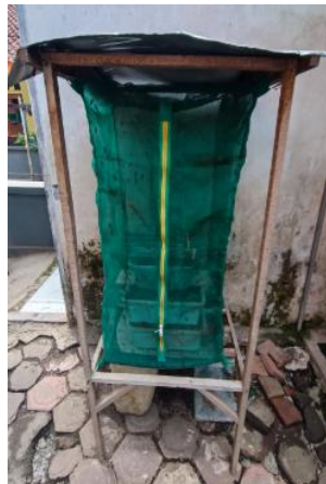
Gambar 7. Kandang Maggot

Gambar 7 menunjukkan kandang maggot , yang sering disebut sebagai biopond, adalah tempat atau wadah yang dirancang khusus untuk membudidayakan larva lalat Black Soldier Fly (BSF) sebagai agen pengurai sampah organik.