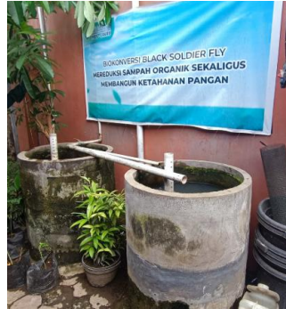
Gambar 6. Kondisi kolam lele

Gambar 6 menunjukkan kondisi kolam budidaya lele yang digunakan dalam kegiatan pemanfaatan maggot sebagai pakan alternatif. Kolam berbentuk bundar dengan dinding beton ini berisi air sebagai media pemeliharaan ikan lele. Di sekitar kolam terlihat lingkungan yang tertata sederhana namun fungsional, mendukung kegiatan budidaya. Kolam ini menjadi bagian penting dalam sistem integrasi, di mana maggot hasil pengolahan sampah organik dimanfaatkan sebagai pakan bernutrisi untuk meningkatkan efisiensi dan produktivitas budidaya lele.