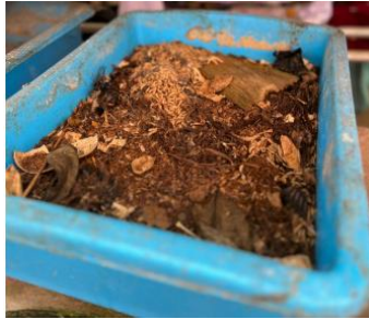
Gambar 3. Proses pemberian pakan maggot ke kolam lele.

Gambar 3 menunjukkan kondisi media budidaya maggot yang berasal dari sampah organik yang telah mengalami proses dekomposisi. Terlihat campuran bahan organik seperti sisa makanan dan daun yang menjadi sumber pakan bagi larva maggot . Media ini memiliki tekstur lembap dan kaya nutrisi, sehingga mendukung pertumbuhan maggot secara optimal sebelum dimanfaatkan lebih lanjut sebagai pakan alternatif untuk budidaya lele.