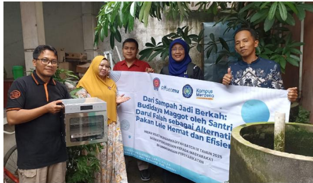
Gambar 2. Dokumentasi tim PKM dari pelaksanaan kegiatan.

Program pengabdian masyarakat berjudul “Budidaya Maggot sebagai Alternatif Pakan Lele Berbasis Sampah Organik di Pondok Pesantren Muhammadiyah Darul Falah Jember” telah berhasil dilaksanakan melalui serangkaian kegiatan terstruktur mulai dari penyuluhan, pelatihan teknis, pendampingan, hingga produksi dan pemasaran. Gambar 2 menunjukkan dokumentasi Tim PKM dari pelaksanaan kegiatan.