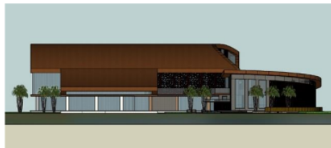
Gambar 3. Gedung Pertunjukan Indoor.

Pada Gedung Pertunjukan Indoor mengadaptasi atap lengkung sesuai dengan konsep ekspresi dari selendang penari jaranan. Pada bagian dinding menggunakan elemen besi laser cut sebagai detail arsitektur pada eksterior, yang dikombinasikan dengan dinding beton serta material kaca untuk memberikan nuansa kombinasi etnik dan modern pada bangunan