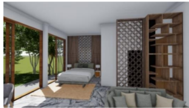
Gambar 8. Interior Lobby & Lounge

Pada interior ruangan Sanggar pelatihan banyak menggunakan kaca untuk membantu latihan para seniman. Pada bagian lobby sanggar pelatihan ditambahkan elemen batu alam untuk menambah kesan etnik yang selaras dengan ruangan lainnya. Untuk material pada dinding diberikan peredam suara agar tidak mengganggu aktivitas diluar ruangan.