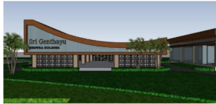
Gambar 4. Gedung Sentra Kuliner

Pada bentuk Sentra kuliner tetap menggunakan atap lengkung dan elemen roster ditambahkan pada bagian dinding untuk memperkaya detail-detail arsitektur pada bangunan sentra kuliner. Serta roster tersebut dapat menjadi penghawaan alami pada bangunan sentra kuliner.