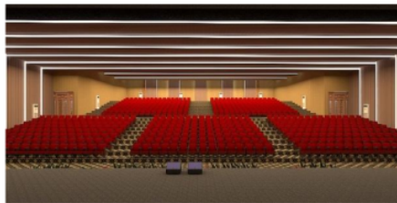
Gambar 6. Interior gedung pertunjukan indoor

Hasil dari transformasi ruang pada kompleks pusat seni ini mengacu pada konsep yang digunakan yaitu " fungsional ". Penggunaan sirkulasi ruang yang mengikuti bentukan ruang, bangunan dan aktifitas pengguna dalam ruang tersebut sehingga pengguna nyaman dalam beraktifitas dan tidak terjadi tabrakan saat beraktifitas. Penyesuaian terhadap kebutuhan pengguna, ruang yang menjadikan ruang lebih fungsional dalam penggunaannya.