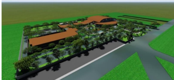
Gambar 2. Bentuk Massa Bangunan

Hasil dari transformasi bentuk kompleks pusat seni ini mengusung konsep “Ekspresif” yaitu menciptakan sebuah bangunan yang mengambil ekspresi dari nilai-nilai yang ada dalam kesenian jaranan. Bentuk yang digunakan pada bangunan merujuk pada bentuk selendang penari jaranan pada massa gedung pertunjukan indoor , sentra kuliner, serta guesthouse ditampilkan dalam transformasi bentuk lebih dinamis yang di tampilkan dengan kombinasi material modern dan alam dengan maksud memperkuat unsur budaya yang berkembang di zaman modern.