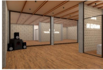
Gambar 7. Interior Sanggar Pelatihan

Pada interior ruangan Sanggar pelatihan banyak menggunakan kaca untuk membantu latihan para seniman. Pada bagian lobby sanggar pelatihan ditambahkan elemen batu alam untuk menambah kesan etnik yang selaras dengan ruangan lainnya. Untuk material pada dinding diberikan peredam suara agar tidak mengganggu aktivitas diluar ruangan.