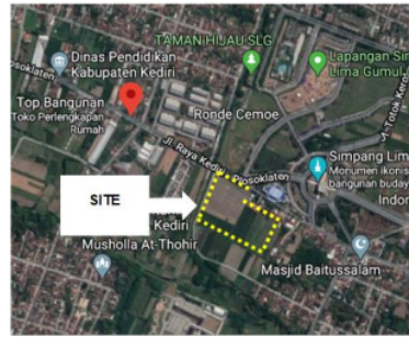
Gambar 1. Lokasi site.

Beberapa hasil dari analisa site sebagai berikut: (1) Berdasarkan Analisis Klimatologi (Cahaya Matahari), penataan banyak massa dan vegetasi yang tepat dapat meminimalisir paparan panas cahaya matahari yang berlebih. Selain itu juga dapat mengaplikasikan secondary skin yang juga berguna sebagai nilai tambah estetis bangunan. (2) Analisis Klimatologi (Arah Angin dan Curah Hujan), penataan banyak massa dan vegetasi yang tepat dapat meminimalisir kecepatan angin serta dapat mengarahkan angin untuk melewati tiap massa bangunan sehingga mendapatkan sirkulasi udara yang baik. Vegetasi juga dapat menyaring debu maupun udara kotor yang dibawa oleh angin. (3) Analisis Kondisi Visual (Orientasi), Perencanaan dan Perancangan Pusat Seni Jaranan Sebagai Wadah Pengembangan Kesenian di Kediri ini menggunakan orientasi ke dalam. Hal ini dikarenakan kondisi sekitar site yang kurang memiliki view yang menarik. (4) Analisis Kondisi Visual (Kebisingan), potensi kebisingan yang ada pada sisi barat lahan dapat diminimalisir dengan cara memberi jarak dari batas site dan digunakan sebagai ruang terbuka hijau. (5) Analisis Zonifikasi, semua fasilitas pada hasil analisa kebutuhan ruang dikelompokkan menjadi area penerima, area publik, semi publik dan privat.