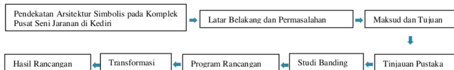
Gambar 1. Bagan Metodologi.

Metode yang digunakan dalam Penelitian ini yaitu analisa deskriptif kualitatif. Sumber data yang diperoleh: (1) Data Primer. Adalah data yang didapat melalui wawancara serta survey secara langsung, antara lain: (a) Kondisi lahan yang berada di Jl. Erlangga Tugurejo, Kec. Ngasem, Kab. Kediri. (b) Studi kasus lapangan terkait objek yang telah terbangun, yaitu Taman Budaya Cak Durasim Surabaya dan Taman Werdhi Budaya Art Center Bali. (2) Data Sekunder. Adalah data yang diperoleh dari buku, internet, dan pustaka atau literatur lainnya yang berkaitan dengan Komplek Pusat Seni Jaranan di Kediri dengan pendekatan tema Arsitektur Simbolis. Beberapa diantaranya: Taman Budaya Jawa Tengah, Menara Phinisi Universitas Negeri Makassar, Batumi Aquarium Georgia , dan United National Memorial Cheongju South Korea .