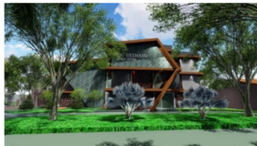
Gambar 5. Guest House

Pada bentuk Sentra kuliner tetap menggunakan atap lengkung dan elemen roster ditambahkan pada bagian dinding untuk memperkaya detail-detail arsitektur pada bangunan sentra kuliner. Serta roster tersebut dapat menjadi penghawaan alami pada bangunan sentra kuliner.