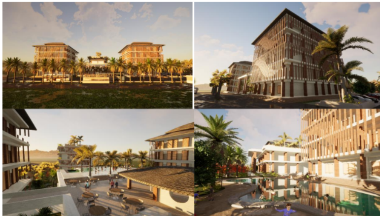
Gambar 5. Perspektif Hotel A

Pembahasan di atas memberikan solusi dari masalah pada daerah Wonosalam. Warga atau pengunjung yang ada diluar daerah Wonosalam juga tenang dengan adanya sanggraloka ini mereka mempunyai tempat yaitu sanggraloka coban selolapis untuk bermalam ataupun menginap bersama keluarga sembari menikmati suasana alam juga mengikuti event tahunan yang ada di daerah. dengan bentuk bangunan yang berarsitektural bertujuan agar pengunjung bisa menikmati suasana yang ada di Wonosalam ini dengan beda karena sebuah desan bangunan yang berarsitektural.