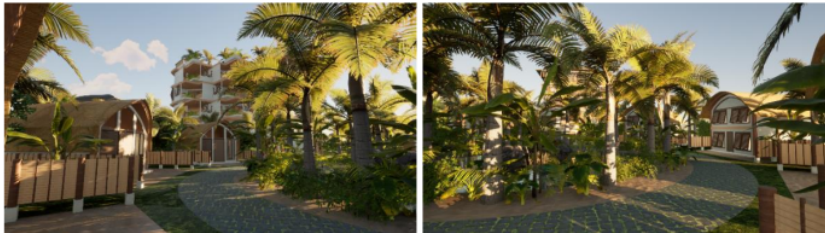
Gambar 7. Perspektif Cottages A & B

Gambar 6 menggambarkan bangunan Hotel B ini merupakan salah satu bangunan yang unik karena balkon yang ada pada hotel ini berbentuk zig zag berguna agar lebih menangkap angin secara maksimal, juga menghalau dari cahaya matahari secara langsung, pada Hotel B memiliki banyak detail arsitektural. Balkon hotel mengadopsi unsur bunga durian yang jatuh, yang ditrasformasikan ke bentuk kisi-kisi pada balkon hotel. Hotel B juga mempunyai keunikan lain yaitu adanya infinity pool pada rooftop , pada rooftop hotel B memfasilitasi pencapaian pemandangan atau keindahan alam yang ada pada site ini dengan maksimal (Fahridho, 2021) .