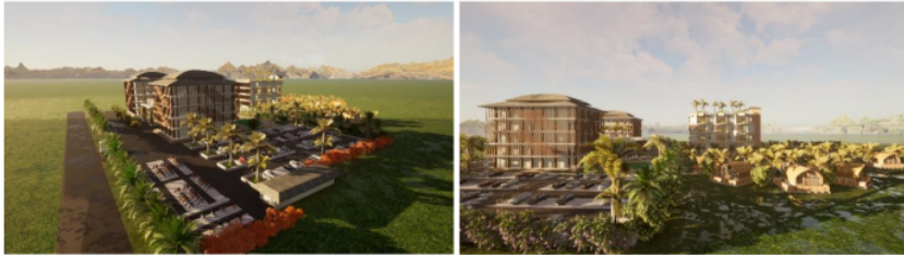
Gambar 8. Perspektif Sanggraloka Coban Selolapis

Pada (Gambar 8. Perspektif Sanggraloka Coban Selolapis), menjelaskan sebuah perspektif mata burung yang diambil dari keseluruhan area Sanggraloka Coban Selolapis.