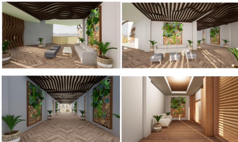
Gambar 8. Perspektif Interior Hotel B

Pada (Gambar 7. Perspektif Hotel A), menunjukkan bentuk interior dari lobby lantai satu pada Hotel A yang mengusung tema Tropical .