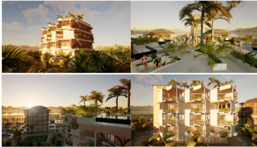
Gambar 6. Perspektif Hotel B

Bisa dilihat untuk pada gambar di atas yaitu ( Gambar 5 ) merupakan hasil rancangan final dari hotel A yang ada di sanggraloka coban selolapis. dari bentuk dari bangunan hotel mengadaptasi dari tropical arsitektur mulai dari secondary skin yang berguna untuk memecah cahaya matahari yang langsung mengenai bangunan, tritisan atau overstek dari atap bangunan untuk menghindari tampias hujan, juga bentuk atap perisai dengan kemiringan lebih dari 30' agar air hujan bisa langsung mengalir ke tanah. penggunaan warna yang cerah juga berfungsi agar cahaya matahari bisa terpantul dan tidak terserap kedalam bangunan.