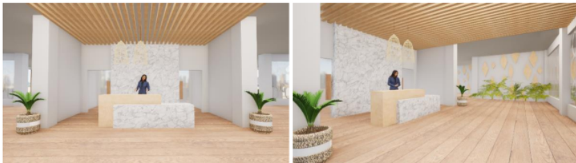
Gambar 7. Perspektif Lobby Hotel A

Pada (Gambar 8. Perspektif Sanggraloka Coban Selolapis), menjelaskan sebuah perspektif mata burung yang diambil dari keseluruhan area Sanggraloka Coban Selolapis.