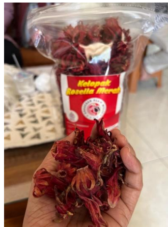
Gambar 5. Bunga Rosela Kering.

Pengeringan menggunakan food dehydrator ini dapat meningkatkan efisiensi dan kapasitas produksi teh bunga rosela. Kualitas dari teh bunga rosela juga meningkat ditandai dengan hasil pengeringan yang lebih seragam dan bahan yang tidak terkontaminasi oleh debu dan kotoran karena proses pengeringan yang tertutup. Dengan menggunakan food dehydrator untuk proses pengeringan maka kadar air rosela kering bisa mencapai 5-7%, waktu pengeringan maksimal 24 jam dengan suhu pengeringan maksimal 70°C. Temuan ini sejalan dengan studi sebelumnya yang menunjukkan bahwa metode pengeringan terkontrol mampu menjaga warna, aroma, serta stabilitas antosianin sebagai pigmen utama pada kelopak rosela (Ledema-Valladolid, dkk., 2020; Sasongko, dkk., 2019). Hasil pengeringan juga tampak masih berwarna merah segar seperti pada Gambar 5.