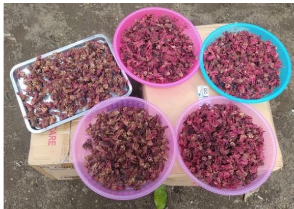
Gambar 1. Proses Pengeringan Kelopak Bunga Rosela Mitra dengan Cara Penjemuran Sederhana.

Titik kendali kritis yang menjadi kendala UMKM Anugerah Alam Wilis saat ini adalah rendahnya efisiensi waktu pengeringan kelopak bunga rosella yang mengakibatkan kualitas dan kapasitas produksi tidak maksimal. Proses pengeringan kelopak bunga rosella selama ini dilakukan dengan bantuan sinar matahari sehingga waktu yang dibutuhkan minimal 2 hari jika cuaca panas, bahkan mencapai 4 hari jika cuaca mendung. Dokumentasi proses pengeringan kelopak bunga rosela di UMKM Anugerah Alam Wilis terlihat pada Gambar 1.