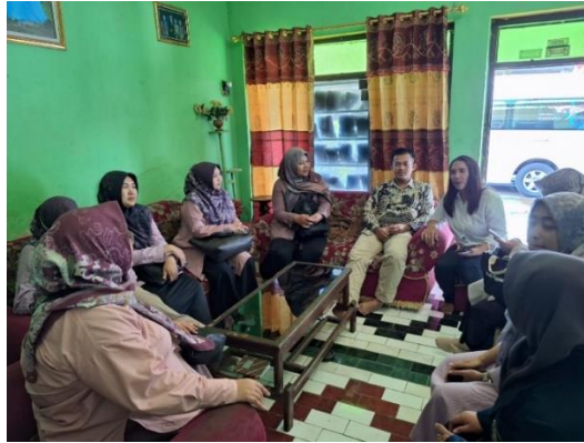
Gambar 3. FGD dengan Mitra UMKM Anugerah Alam Wilis.

Mitra UMKM Anugerah Alam Wilis berkontribusi dan berpartisipasi dalam kegiatan sebagai subjek dan objek program pada seluruh pelaksanaan kegiatan yang meliputi diseminasi teknologi berupa Food Dehydrator, kegiatan FGD dan brainstorming , bimtek dan pendampingan. Dokumentasi kegiatan FGD dengan mitra terlihat dalam Gambar 3.