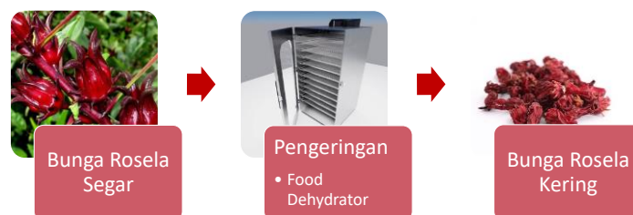
Gambar 2. Proses Diseminasi Teknologi menggunakan Food Dehydrator .

Salah satu upaya untuk meningkatkan efisiensi proses dan kualitas produk teh bunga rosella yaitu dilakukan fasilitasi Food Dehydrator untuk pengeringan bunga rosella sehingga didapatkan kadar air optimum, waktu pengeringan lebih singkat dan suhu pengeringan lebih stabil dan terkontrol sehingga kualitas produk menjadi lebih baik lagi. Proses diseminasi teknologi menggunakan food dehydrator dapat dilihat pada Gambar 2.