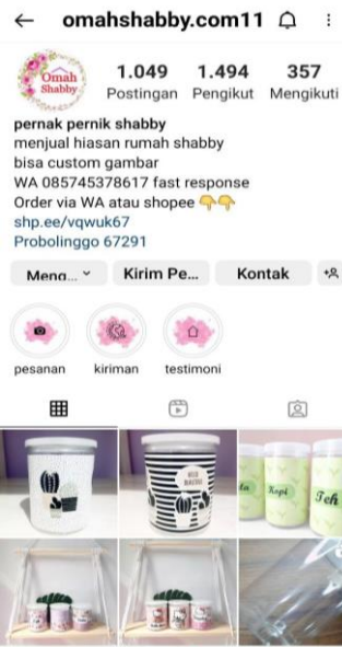
Gambar 4. Homepage Instagram untuk Pemasaran Elektronik UKM Omah Shabby.