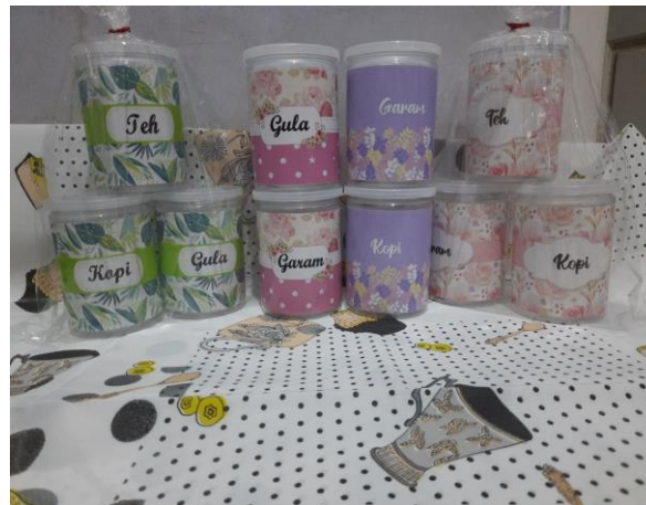
Gambar 1. Tabung Inovatif

Kegiatan penyuluhan dan praktik keterampilan desain grafis berbasis E-marketing bagi mahasantri dan UKM Omah Shabby di bidang usaha kecil pernak-pernik hiasan rumah dapat meningkatkan pemahaman dan skill mahasantri. Selama ini, sistem pemasaran produk masih dilakukan manual. Dengan adanya skill baru yang diperoleh, diharapkan UKM Omah Shabby dan wirausaha baru bagi mahasantri dapat memasarkan jasa penjualan produk secara online sehingga mampu menambah kesejahteraan ekonomi usaha rumahan. Hasil pelatihan desain grafis mahasantri dapat dilihat pada Gambar 1 dan Gambar 2.