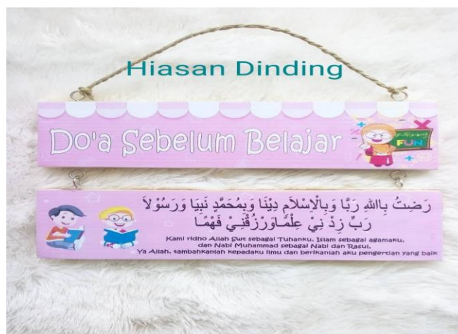
Gambar 2 Hiasan Dinding